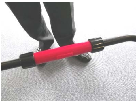
⑬反対側も同じ手順でジョイントを閉じたままキャップをねじ込みます。