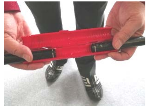
⑩左右の黒いバーが平行になるように調整して、ジョイントの溝にセットします。