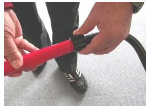
⑫ジョイントをしっかりと閉じたまま黒いバーに付いているキャップをしっかりとねじ込みます。