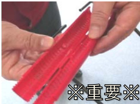
⑨別パーツのジョイントを開きます。