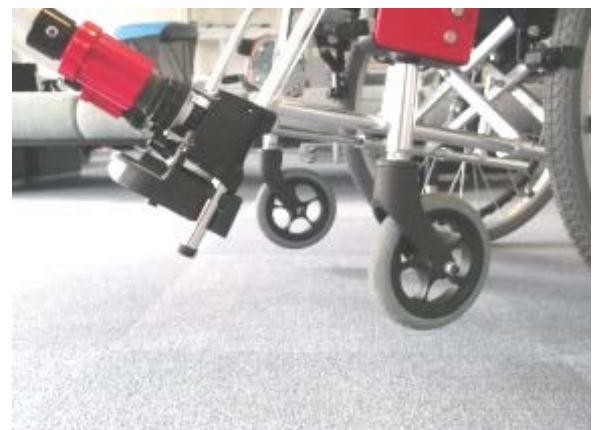
前輪が浮くので段差にも引っかからず細かい振動も軽減されスムーズに進むことができます！