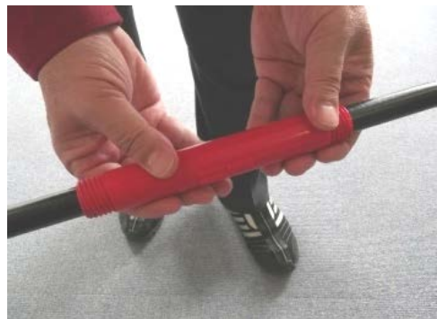
⑪ジョイントをしっかりと閉じます。